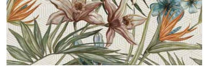
PADEFLO PALETTE FLORAL COMP/2 (2 pezzi / pieces) 30x90 cm 12"x36" Rettificato / Rectified 243 PZ (2 pezzi / pieces)