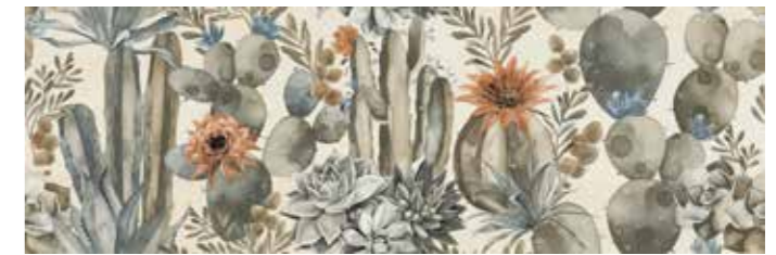
PADECA PALETTE DECOR CACTUS 30x90 cm 12"x36" Rettificato / Rectified 112 MQ