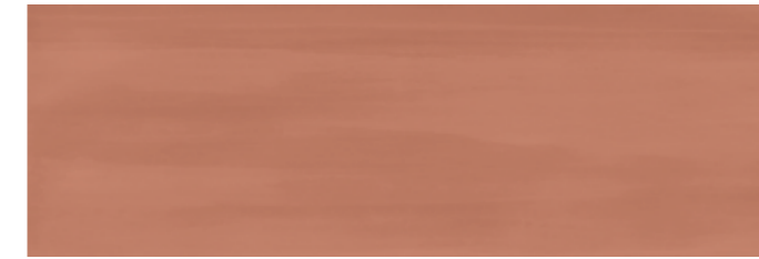
PAROU PALETTE ROUGE 30x90 cm 12"x36" Rettificato / Rectified 112 MQ