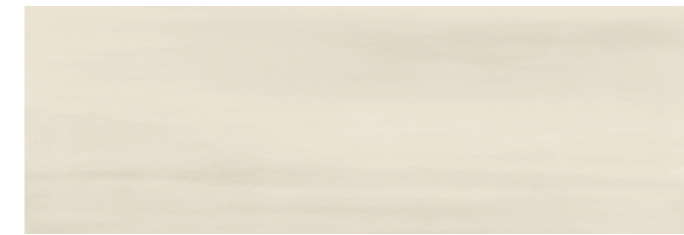
PABLA PALETTE BLANC 30x90 cm 12"x36" Rettificato / Rectified 112 MQ