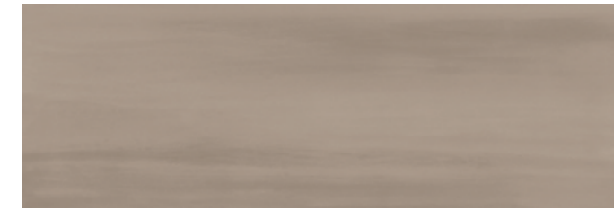
PAGRI PALETTE GRIS 30x90 cm 12"x36" Rettificato / Rectified 112 MQ