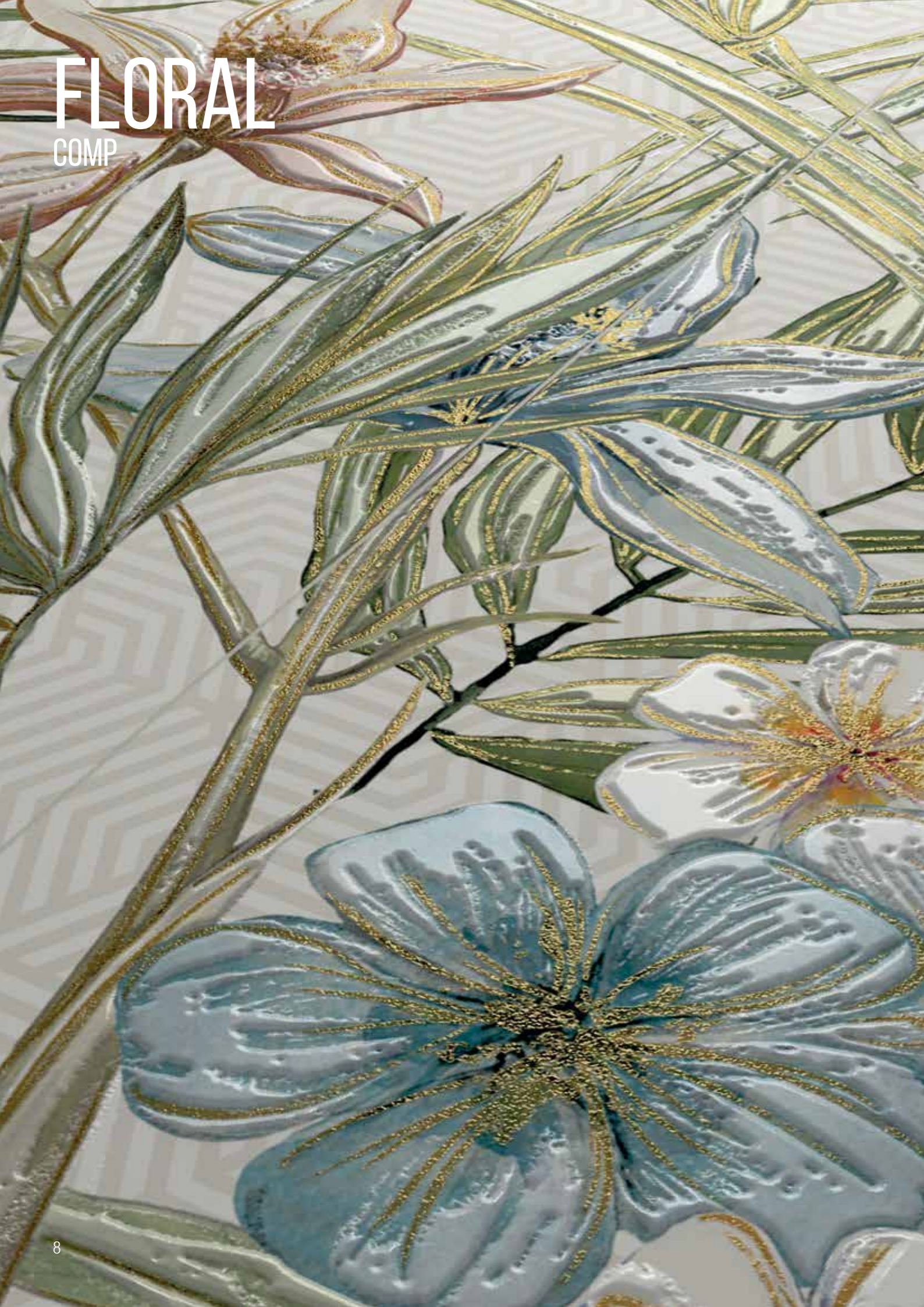
PALETTE BLUE 30x90 cm 12"x36" | FLORAL COMP 30x90 cm 12"x36" // SPATULA GREY 80x80 cm 32"x32"