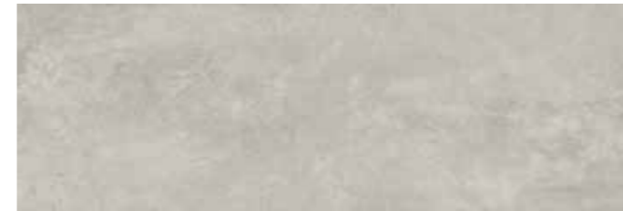
SOGGR SOGNO GRIGIO 30x90 cm 12"x36" Rettificato / Rectified 112 MQ