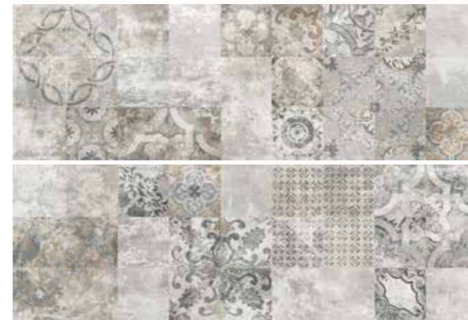
SOGDEGR SOGNO DECORO GRIGIO 30x90 cm 12"x36" Rettificato / Rectified (2 pezzi/pieces) 112 MQ * MIX