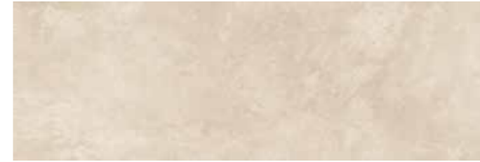
SOGBE SOGNO BEIGE 30x90 cm 12"x36" Rettificato / Rectified 112 MQ