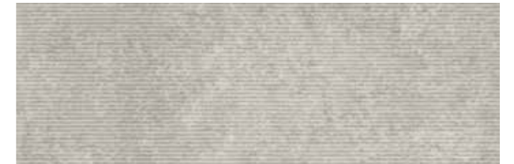
SOGSTGR SOGNO STRUTTURA GRIGIO 30x90 cm 12"x36" Rettificato / Rectified 112 MQ