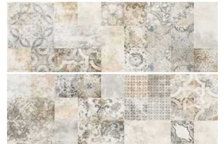
SOGDEBE SOGNO DECORO BEIGE 30x90 cm 12"x36" Rettificato / Rectified (2 pezzi/pieces) 112 MQ * MIX

* MIX I decori sono soggetti misti e sono inscatolati in modo casuale . Decorations are mixed subjects and are randomly packed.