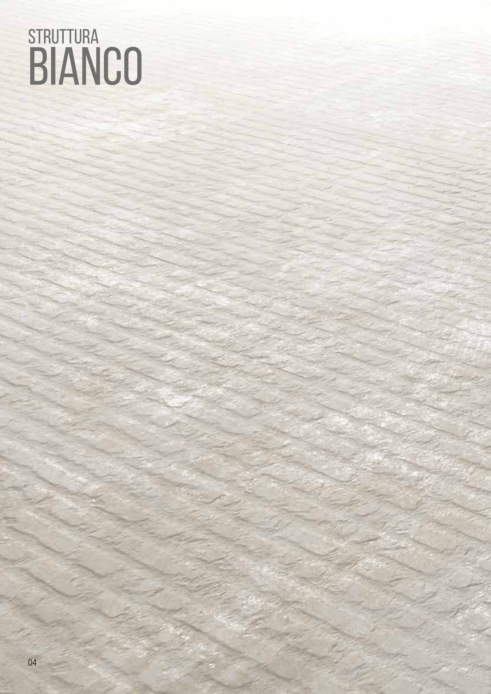
SOGNO STRUTTURA BIANCO 30x90 cm 12"x36" | DECORO BEIGE 30x90 cm 12"x36"