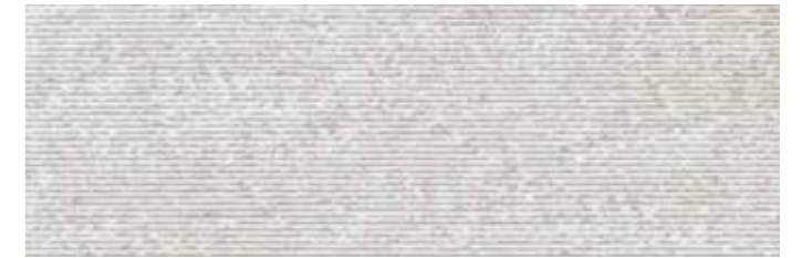
SOGSTBI SOGNO STRUTTURA BIANCO 30x90 cm 12"x36" Rettificato / Rectified 112 MQ