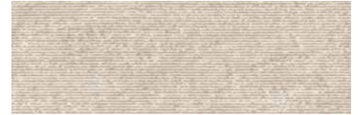
SOGSTBE SOGNO STRUTTURA BEIGE 30x90 cm 12"x36" Rettificato / Rectified 112 MQ